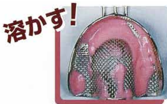
10倍希釈液に12時間浸漬