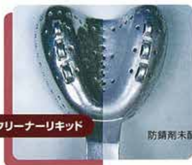
10倍希釈液に1週間連続使用