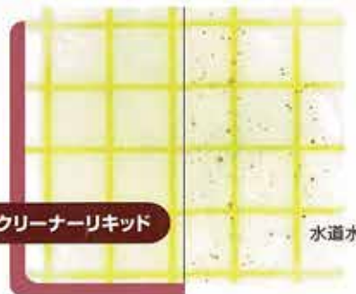
印象材浸漬液をフィルム培地で検査